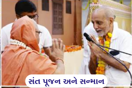
સંત પૂજન અને સન્માન