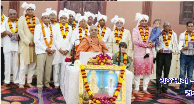
यशभान - सठयशभान संभान