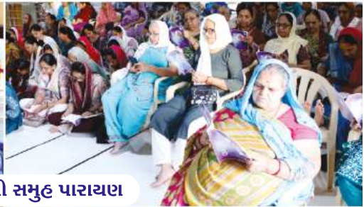
વયનામૃત સહસ્ત્રાર્થ તથા બાપાશ્રીની વાતોની સમુદ પારાયણ