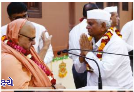
૧૯૧ માં અબજુબાપાશ્રી પ્રાગટ્ય ઉપલક્ષ્યે