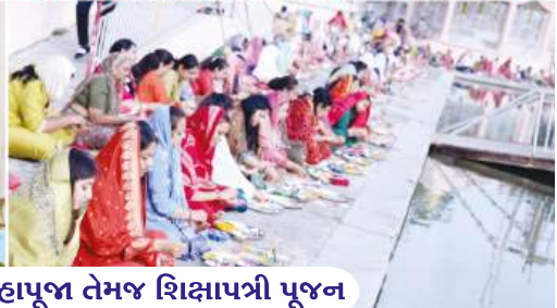
શિક્ષાપત્રી દ્વિશતાબ્દિ એવમ્ બાપાશ્રી પ્રાગટ્ય ઉપલક્ષ્યે મહાપૂજા તેમજ શિક્ષાપત્રી પૂજન