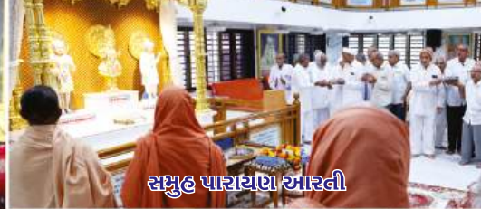
समुह पारायण आरती