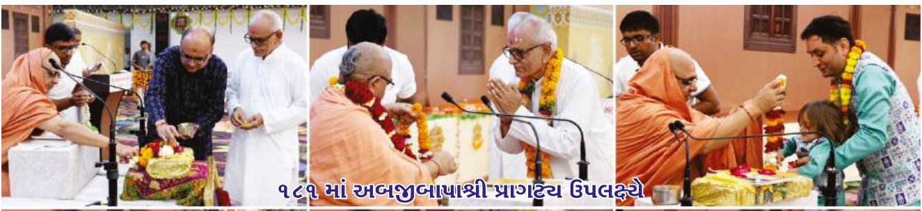
૧૮૧ માં અબજુબાપાશ્રી પ્રાગટ્ય ઉપલક્ષ્યે